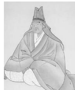
八橋検校 やつはしけんぎょう 1614~1685