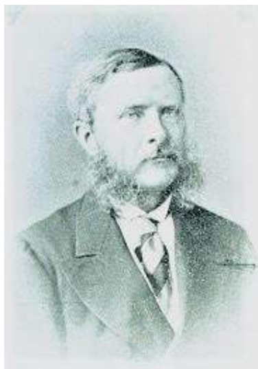
Charles Wirgman (1832-1891)